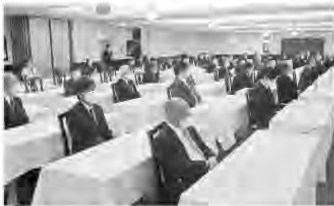
受賞された会員の皆様