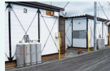
仮設住宅へのLPガス供給