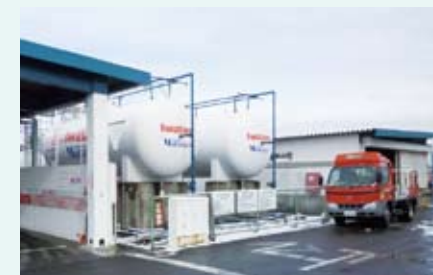
地震直後からLPG車で配送

東日本大震災の被災地では、ガソリン、軽油が不足しましたが、LPG車の燃料補給は確保でき、人員・物流輸送の両面で大いに活躍しました。