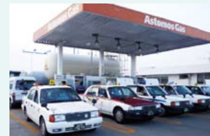
被災地の足、タクシーに燃料供給