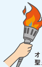
オリンピック 聖火リレー・トーチ