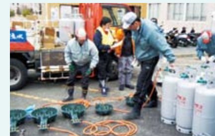
避難所へのLPガス供給

LPガス(プロパンガス)は、地震の被災復旧も早く、分散型エネルギーの利点を生かし、避難所での炊き出しや暖房に活躍しました。