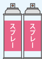
ヘアスプレー等の 噴射剤