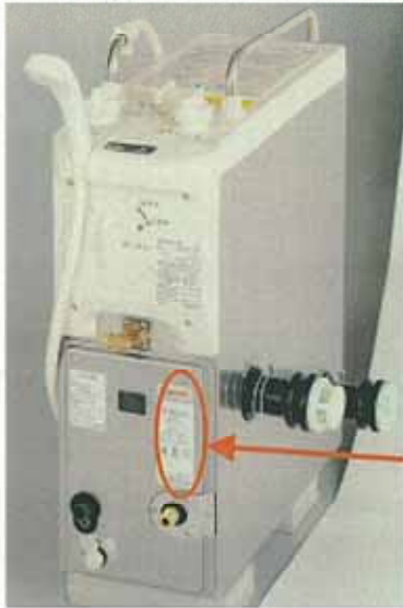
【給湯・シャワー付きタイプ】